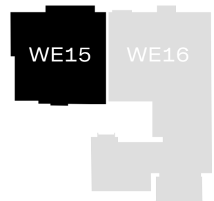
DG / Vorderhaus

Kompaktes Penthaus-Studio mit Blick über die Dächer Berlins. Wohnung 15 befindet sich im Dachgeschoss des Vorderhauses. Sie bietet all das, was ein modernes Studioloft in der Stadt benötigt, um auf kleinem Raum optimal ausgestattet und eingerichtet zu sein. Das Highlight ist die riesige Gaube, die den Wohnbereich belichtet und einen fantastischen Blick auf die Dachlandschaft der Karl-Kunger-Straße ermöglicht. Angrenzend an den Eingangsbereich mit Garderobe liegt der 24 m 2 große Küchen-, Wohn- und Schlafbereich. Dies bietet durch seine Aufteilung die Möglichkeit, Essen und Schlafen voneinander abzutrennen. Das Badezimmer mit natürlicher Belichtung und Belüftung über ein Oberlicht verfügt über eine bodentiefe XXL-Dusche.